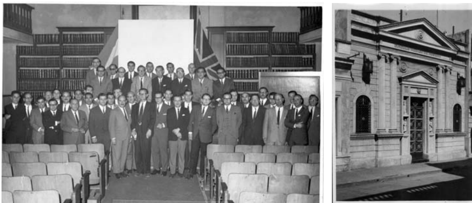
Auditorio del Círculo Médico y su antigua portada